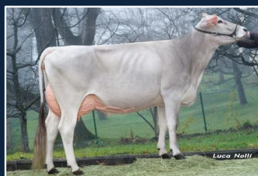
PUCK - Zeder