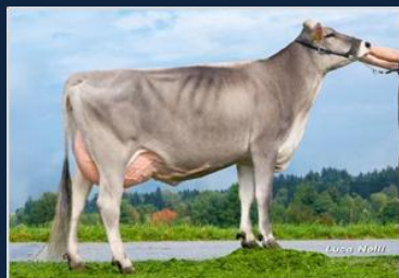
PRINZ - Buche