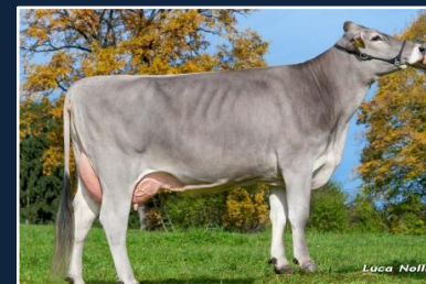
VICTORY - Ragu