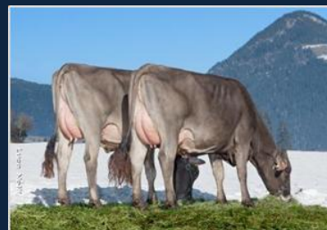
VOICE - Thea & Prinzessin